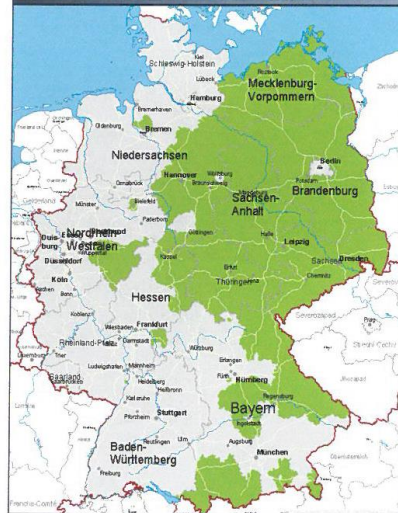
Stichtag 1. Januar 2020

Weitere Infos zu AutoView und Marktanalysen erhalten Sie über Markus Frömgen, Leiter AutoView& Data unter mfroemgen@bbe-automotive.de