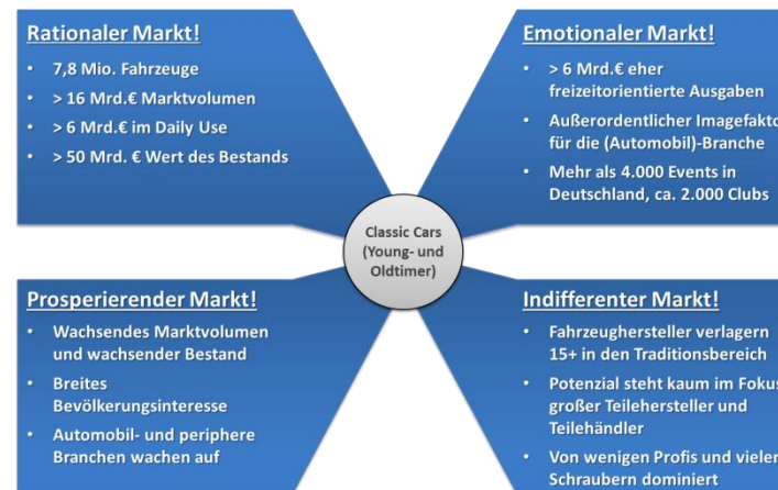
Rang 16 bis 30 Oldtimer