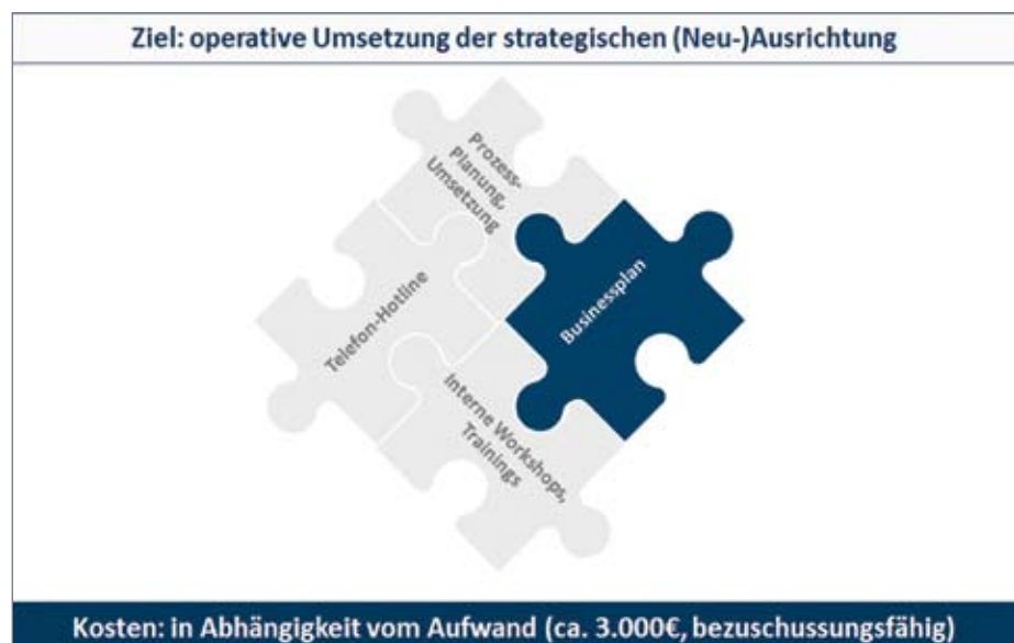
Chart 2: Modul 2 im Task-Force-Konzept ist ein Coaching, bei der die BBE-Berater das Unternehmen bei der operativen Umsetzung der strategischen (Neu-)Ausrichtung begleiten.